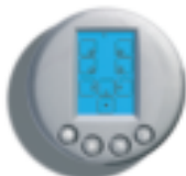
TYDOM 200 Telemando multifunción En casa