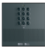
TYDOM 310 Transmisor telefónico Esté dónde esté