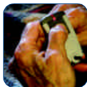
Una simple pulsación